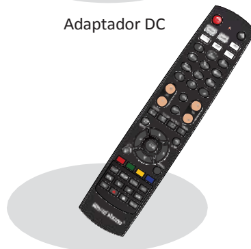
Mando de control remoto